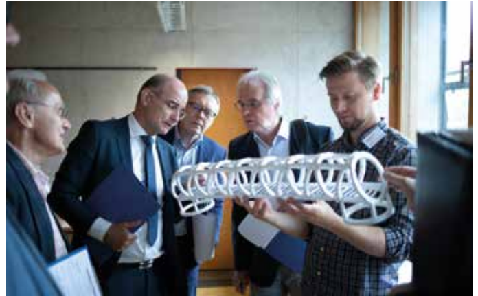
Die Jury begutachtet ein Modell beim letzten Junior.ING Wettbewerb zum Thema „Brücken“ im Jahr 2018

Mitmachen können beim Bundesweiten Schülerwettbewerb Junior.ING alle Schülerinnen und Schüler, die Lust haben, ein Modell unter den vorgegebenen Bedingungen möglichst durchdacht und kreativ zu konstruieren – als Gruppe oder als