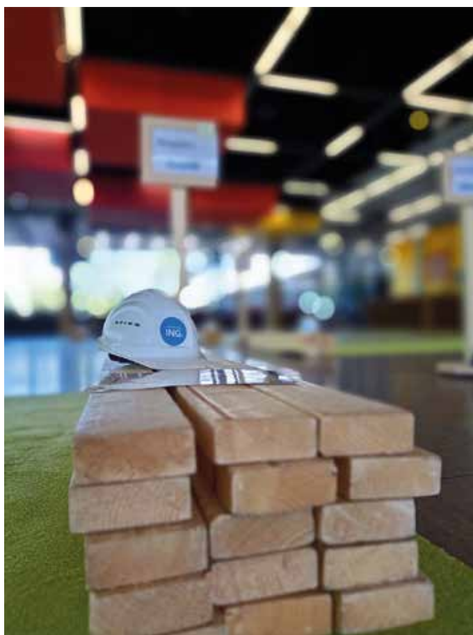
Die Ruhe vor dem Ansturm der Schülerinnen und Schüler beim Brückenbautag in Köln am 1. September 2022

Dazu erhält jede Gruppe einen einfachen Bauplan der Leonardo-Brücke und darf als erste Teamleistung die Bauleitung bestimmen, die dann den weißen Ingenieurshelm tragen darf. Sodann wird der Plan studiert, ausprobiert und improvisiert, bis jede Schülergruppe das Prinzip der Leonardo-Brücke verstanden hat. Natürlich beantwortet das Team der IK-Bau NRW Fragen und hilft, wenn es nötig ist, sodass zum Ende dieser Einführungsrunde alle Teams die gleichen Voraussetzungen und den gleichen Wissensstand besitzen. Jetzt geht es in den eigentlichen Wettbewerb und die Teams bauen ihre Brücke auf Zeit.