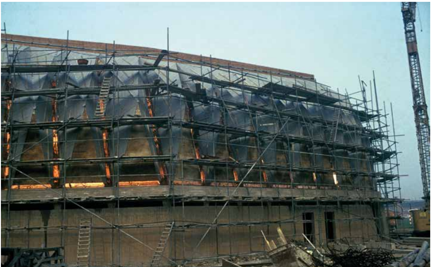
Kirche St. Paulus, Neuss, 1966/67, Architekt Fritz Schaller, Foto der Baustelle, o.D.

Für die weitere Erschließung wird ein Katalog für eine umfas-