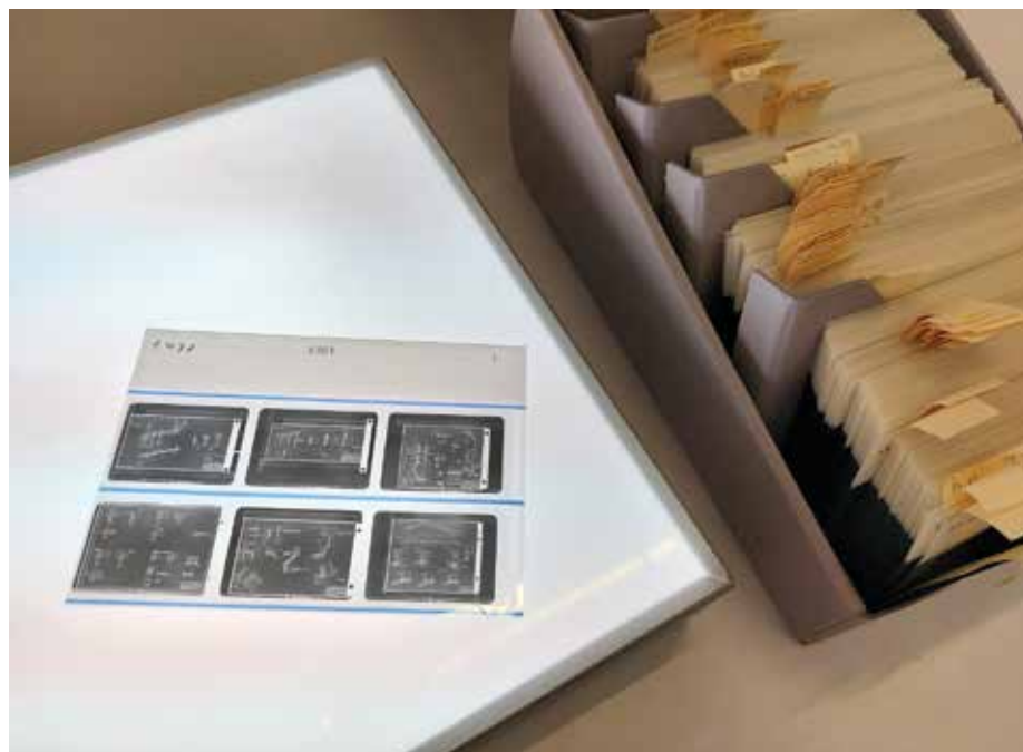
Mikrofilm-Jacket mit Negativstreifen

Rückblickend wurde die Corona-Krise im Baukunstarchiv NRW wie auch in zahlreichen anderen Archiven zur Chance für das Digitale. Erste Ansätze zum Ausbau einer digitalen Infrastruktur waren Grundlage für ein erstes größeres Digitalisierungsprojekt mit Pilotcharakter. Eine Projektmitarbeiterin konnte langfristig für den Aufbau des „Digitalen Archivs“ gewonnen werden, so dass das dabei gewonnene Know-how nun in die weitere Arbeit einfließt. Seit Februar 2019 baut sie diesen Aufgabenbe-