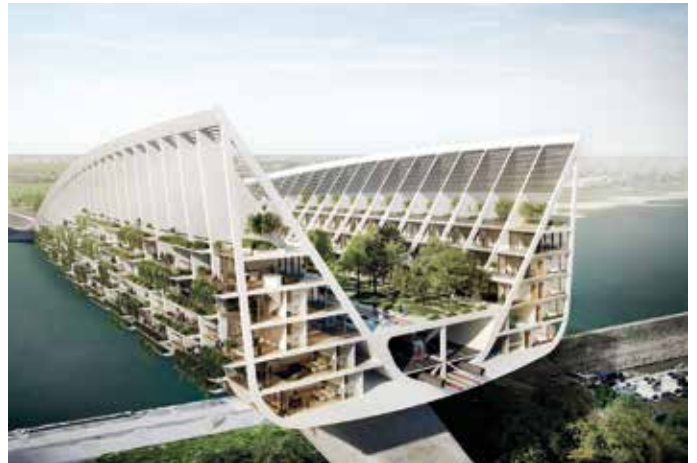
Das Modell der Green Bridge von RKW Architektur+